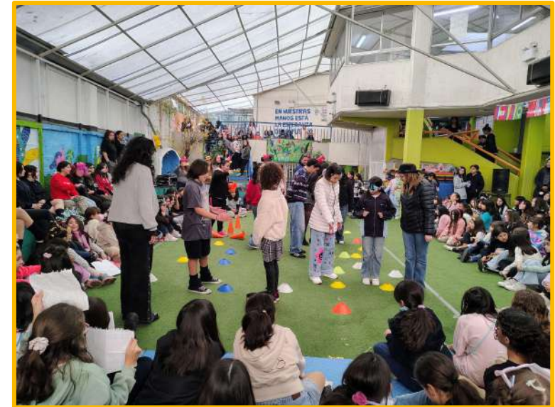
Día del/la Estudiante