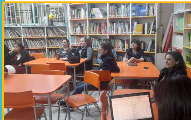
Jornada socialización RI