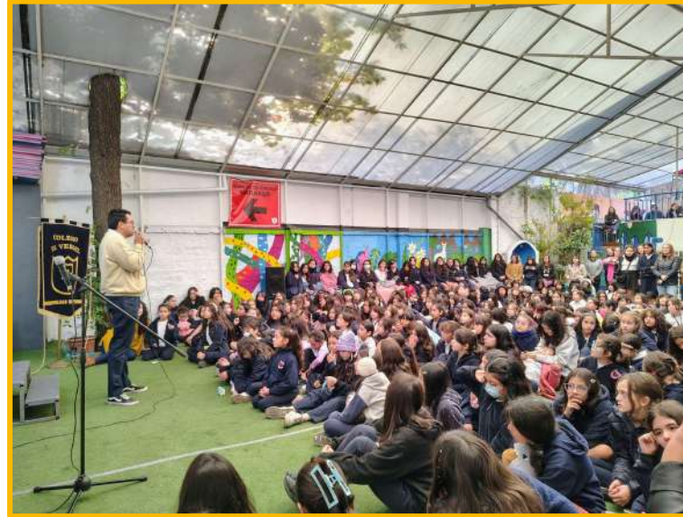
Semana del Libro