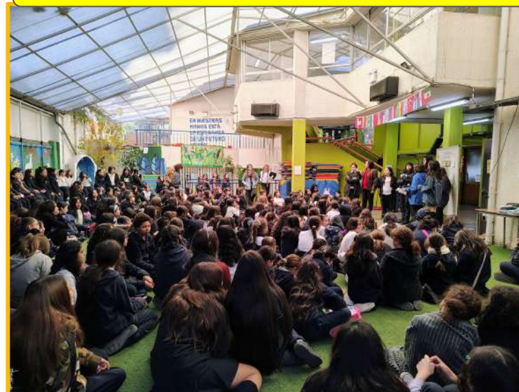
Elección Centro de Estudiantes