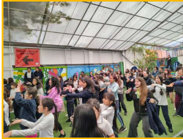
Día del Deporte