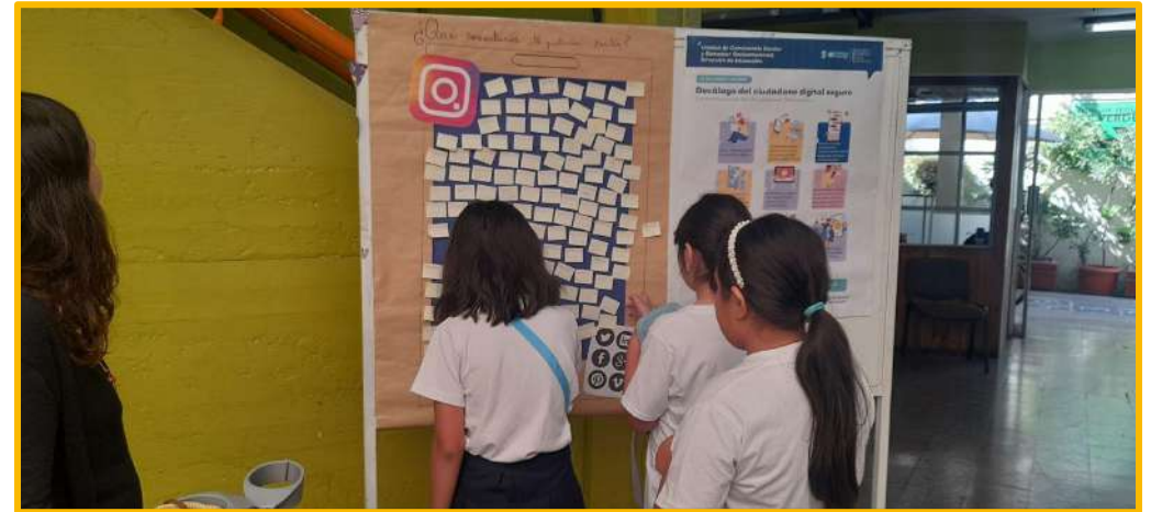
Día del contra Ciberacoso